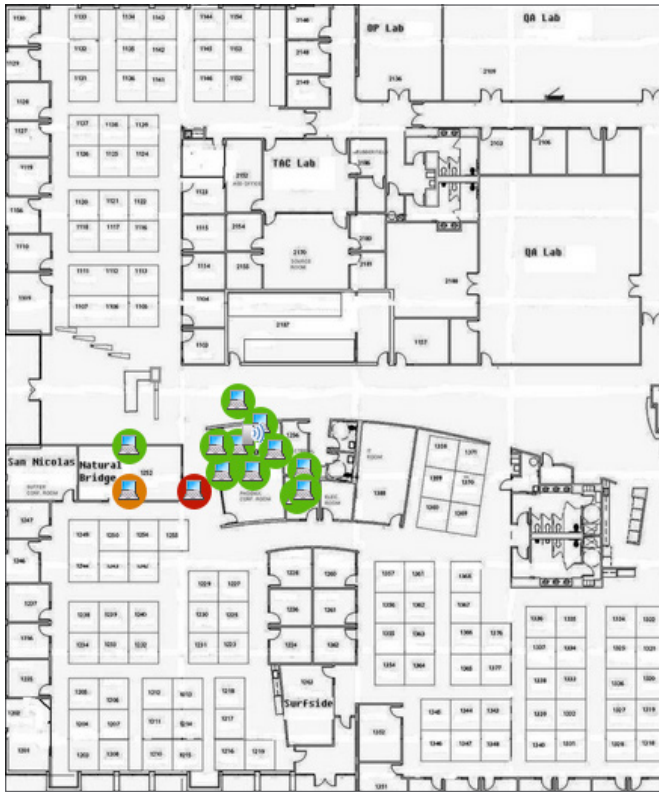
Figura 2: Este plano muestra un cliente dañino (rojo), que ClientMatch dirigirá automáticamente a un mejor AP y radio para optimizar el rendimiento general.

El último estándar de Wi-Fi mejora el rendimiento, la velocidad y la eficiencia con funciones clave como OFDMA, 1024-QAM y MU-MIMO bidireccional. En combinación con la tecnología ClientMatch patentada por Aruba, los clientes compatibles con 802.11ax se agruparán ahora en entornos de 802.11ax, así como en entornos híbridos de 802.11a/b/g/n/ac/ax para aprovechar al máximo las capacidades de MU-MIMO y maximizar la experiencia del usuario.