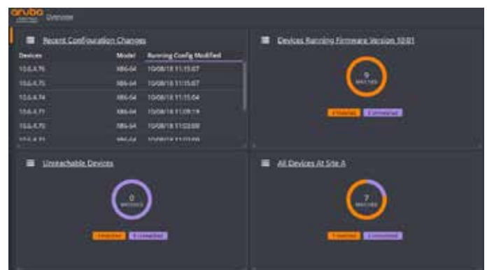
Figura 1: Panel principal de Aruba NetEdit