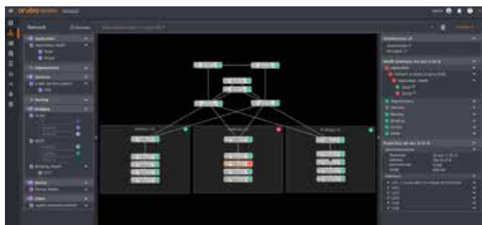
Figura 2: Pestaña de red en NetEdit donde se resalta un problema de la aplicación Skype

Tras las implementación, NetEdit recopila automáticamente información de estado de la red y los servicios antes y